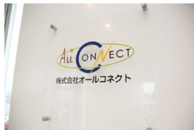
2005年の設立以来、めざましい成長を遂げているALL CONNECT。2009年2月期は年商12億円に迫る。

SEOへの取り組み、コールセンターの本格稼働、継続的なWebサイトの改善などにより、売れ続ける仕組みを構築していく。