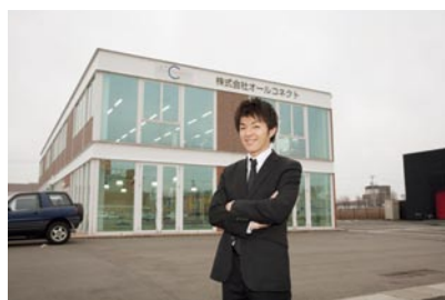
会社の拠点を福井県に置くことで、オフィス賃料を低く抑え、浮いたコストを人材育成・採用に投資している。